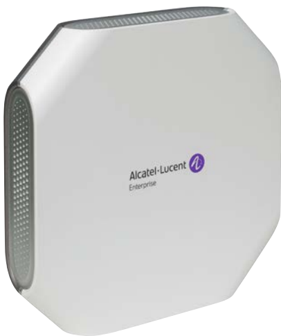
OmniAccess Stellar AP1101 Wi-Fi Access Point interno