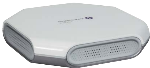
OmniAccess Stellar AP1231 Wi-Fi Access Point interno

A conectividade sem fio desempenha uma função crucial para melhorar essa experiência. De atualizações de status enviadas para o dispositivo móvel do passageiro à emissão de bilhetes, check-in, segurança e proteção. Os passageiros estão acostumados a conseguirem se conectar de qualquer lugar, e isso deve ser mantido durante o deslocamento.